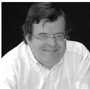
Composition des chants