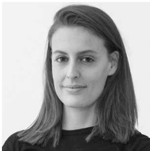
Communication | médias sociaux