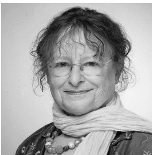
Direction artistique | Recherches historiques